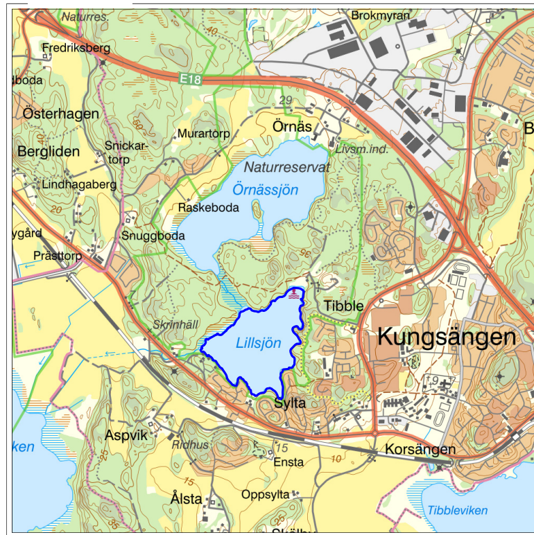
Skala 1:50 000. Ur karta 50 000 © Lantmäteriet.